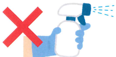
フードモデルへの直接の噴霧