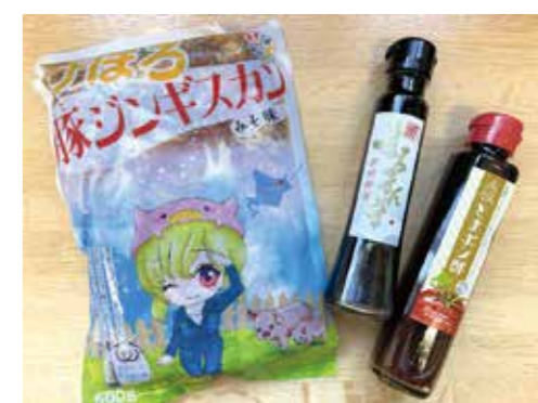
びほろ豚ジンギスカン・豚醤油・とまポン酢