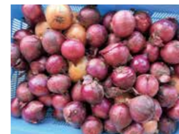
減農薬栽培の赤玉ねぎ

また、ラーメンやうどんの麺は、全て町産小麦を使用し、さらに、地元の高校生が授業で育てた小麦の麺を、小・中・高校で一斉に提供する年一度の給食メニューは、地域のつながりを感じながら味わう大切な機会となっています。