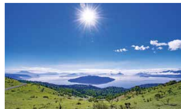
美幌峠から一望できる屈斜路湖

また、夏には40回以上の歴史を誇る「美幌観光和牛まつり」が開催され、地域に根ざした一大イベントとして多くの人で賑わっています。