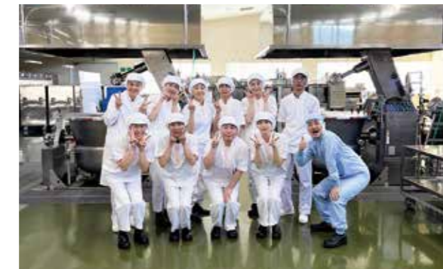
暑さ対策と異物混入防止のため調理着をトリコットシャツへリニューアル