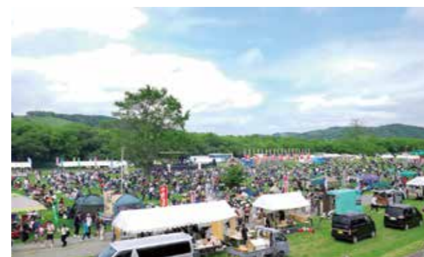
美幌観光和牛まつり