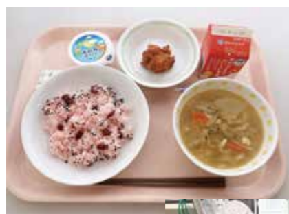
お祝い献立 (赤飯、けんちん汁、ザンギ、すだちゼリー、牛乳)

本稿を書いている今日は卒業式の前日、お祝い献立として赤飯を提供します。本校で提供している赤飯は、ピンク色で甘納豆を合わせた、北海道ならではのものです。この日ばかりは食紅で色をつけますが、濃すぎないか、薄すぎないかとドキドキしながら、少しずつ美しい桜色に調整していきます。他にも子どもたちが大好きな「ザンギ」と「すだちゼリー」を組み合わせ、おめでどうの気持ちをいっぱい込めて作っています。