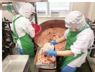
うるち米を混ぜ、蒸気釜で炊飯

赤飯は決して全員に人気のある献立ではありません。給食でしか食べたことがないという子もいます。それでも、卒業を迎える6年生は、そこに込められた意味を受け取り、「ありがとうございます!」と笑顔で返してくれて、成長したなあ嬉しくなります。