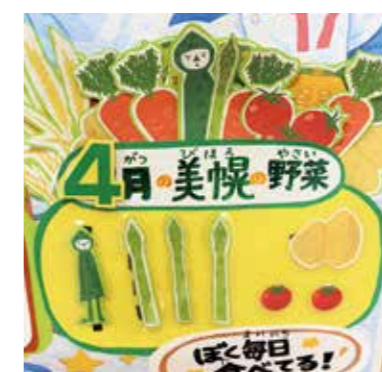
小学校の食育掲示