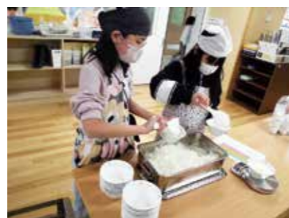
適切な量を知るためにデジタル秤を配置

こうした個別指導を通して、給食指導のあり方についても深く考えるようになりました。いつも残菜がほとんどない学級を見に行くと、一部の肥満傾向にある児童が大盛りで食べている様子が見られることもあります。本人は満足し、食品ロスがなくなるため、周りも良いことと捉えがちですが、児童の健康という視点から見ると課題が残ります。思えば、自分自身もかつてはそのように捉えていた、と反省するところでした。