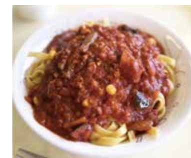
地元の恵みが奏でるハーモニー「なかよしパスタ」