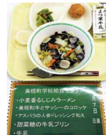
北海道学校給食コンクール優良賞の献立